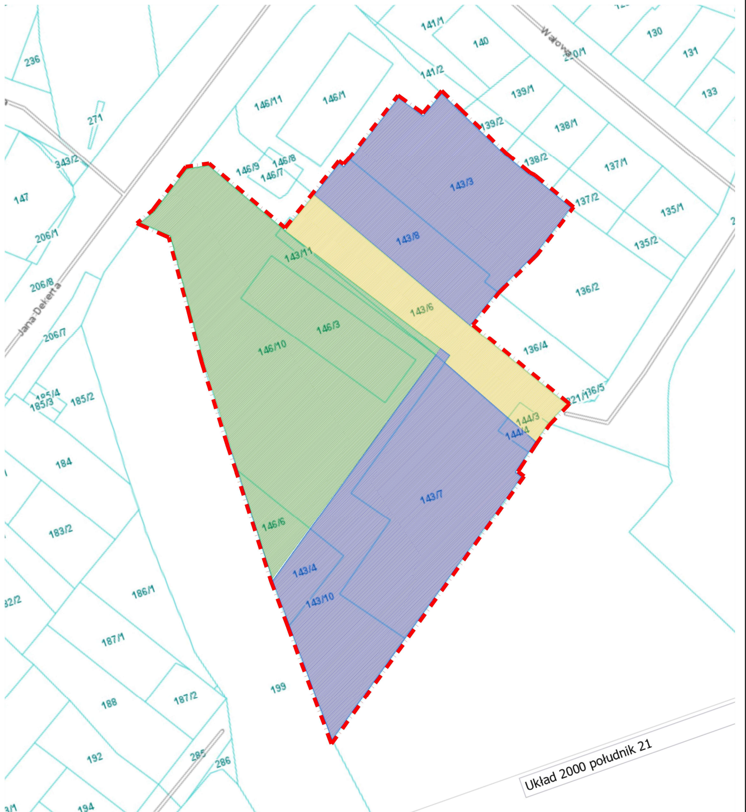
PLAN SYTUACYJNY SKALA 1:1000