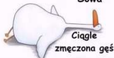
Ciągle zmęczona gęś