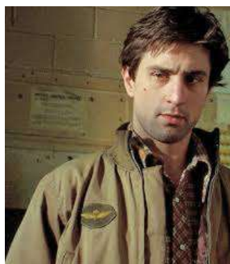
ROBERT DE NIRO FOTOSY Z FILMU TAKSÓWKARZ

Robert De Niro od dekad zachwyca widzów rolami, które zmieniły kino. Trudno wyobrazić sobie dyskusję o największych aktorach bez nazwiska Roberta De Niro. To artysta, który z niezwykłą swobodą porusza się między rolami ludzi niebezpiecznych, emocjonalnie kruchych, ironicznych albo kompletnie zagubionych. Filmy, które najpełniej pokazują skalę talentu De Niro to: Taksówkarz, Wściekły Byk, Ojciec chrzestny II, Chłopcy z ferajny, Łowca jeleni, Gorączka.