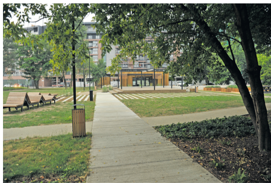
Park Stacja Wisła

Poprawa komfortu życia to także dbałość o otoczenie. Warto więc przypomnieć projekty rewitalizacyjne, które często łączą się z zagospodarowaniem terenów zielonych i rekreacyjnych. Przywołać tu można projekt parku Zabłocie – Stacja Wisła, Klaster Innowacji Społeczno-Gospodarczych na Zabłociu, rewitalizację zdegradowanych obszarów Nowohuckiego Centrum Kultury przy al. Jana Pawła II albo lokalne projekty, o mniejszej