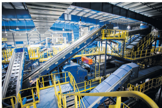
Barycz linia technologiczna

Kraków zbliżył się do tego celu realizując szereg projektów proekologicznych, począwszy od kompleksowego Programu Ograniczania Niskiej Emisji (PONE), polegającego na dofinansowaniu wymiany pieców węglowych na mniej uciążliwe dla środowiska systemy ogrzewania, po szeroko zakrojoną termomodernizację obiektów publicznych. Na poprawę środowiska oraz zdrowia mieszkańców pozytywny wpływ miała też realizacja „Programu usuwania wyrobów z azbestu” czy rozbudowa i automatyzacja linii technologicznej sortowni odpadów komunalnych w Baryczu, która zmodernizowała system gospodarki odpadami.