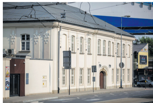
Muzeum Podgórze

skali finansowej i terytorialnej, ale istotnie poprawiające wygląd najbliższego sąsiedztwa. Przykład to inicjatywa „Spotkajmy się na podwórku”, w ramach której zrewitalizowano wnętrza kwartałów zabudowy na terenie Nowej Huty i podwórza Staro- Podgórze. Zagospodarowywane i odnawiane są również obszary wokół starych fortów – stają się one miejscem chętnie odwiedzanych przez mieszkańców.