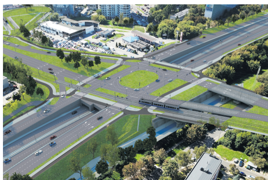
Linia tramwajowa Krowodrza Górka-Górka Narodowa, wizualizacja INTERCOR Sp. z o.o., TOR-KRAK Sp. z o.o.

Bardzo ważna dla komfortu przemieszczania się była realizacja projektów związanych z integracją różnych środków transportu o znaczeniu ponadlokalnym. Na budowę węzłów przesiadkowych, stacji Szybkiej Kolei Aglomeracyjnej, parkingów P+R i rozwój systemu informacji dla podróżujących przeznaczono ponad