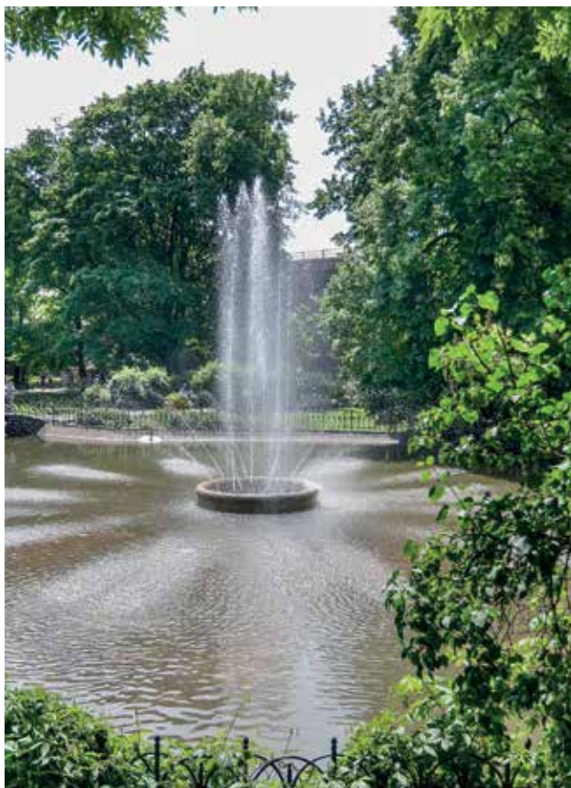
Stońce, woda, zieleń – znak, że lato coraz bliżej!