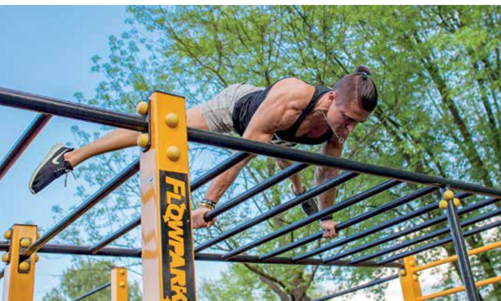
Streetwork park w Dzielnicy XIV Czyżyny to projekt z I edycji budżetu obywatelskiego

*zdjęcie na s. 4 – Historyczny mural na Kazimierzu – projekt z II edycji BO – został nagrodzony w konkursie na najlepsze projekty zgłoszone lub zrealizowane w Polsce w ramach samorządowych budżetów obywatelskich „Mieszkam.tu! Mądre pomysły na mądre miasto!”