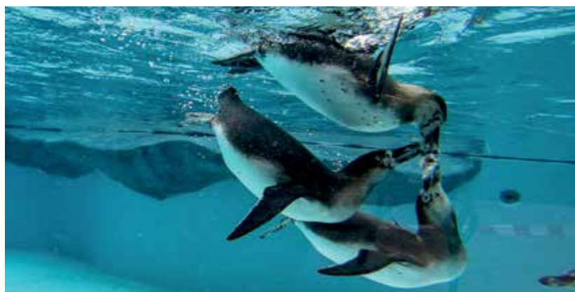
Pingwinki w krakowskim ZOO będzie można oglądać od 9 czerwca!