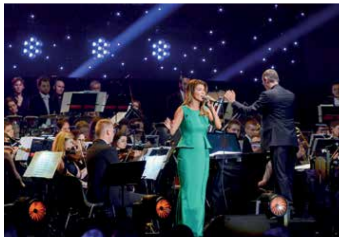
Podczas Festiwalu Muzyki Filmowej Edyta Górniak brawurowo zaśpiewała piosenkę z filmu „Pocahontas” pt. „Kolorowy wiatr”