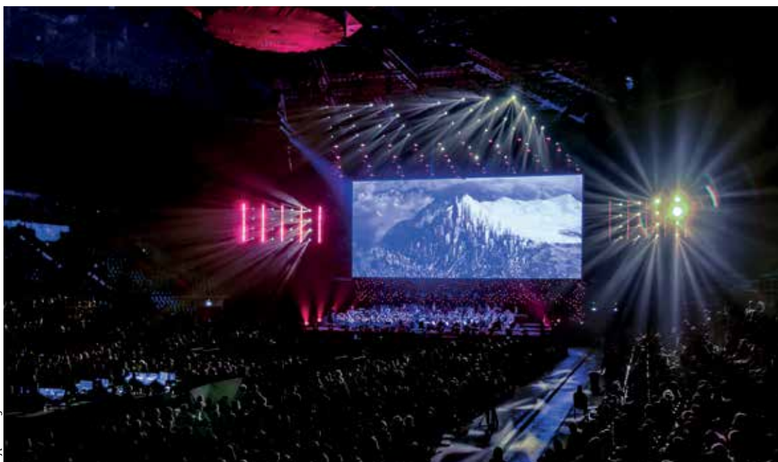
TAURON Arena Kraków podczas Festiwalu Muzyki Filmowej zapelniona była po brzegi