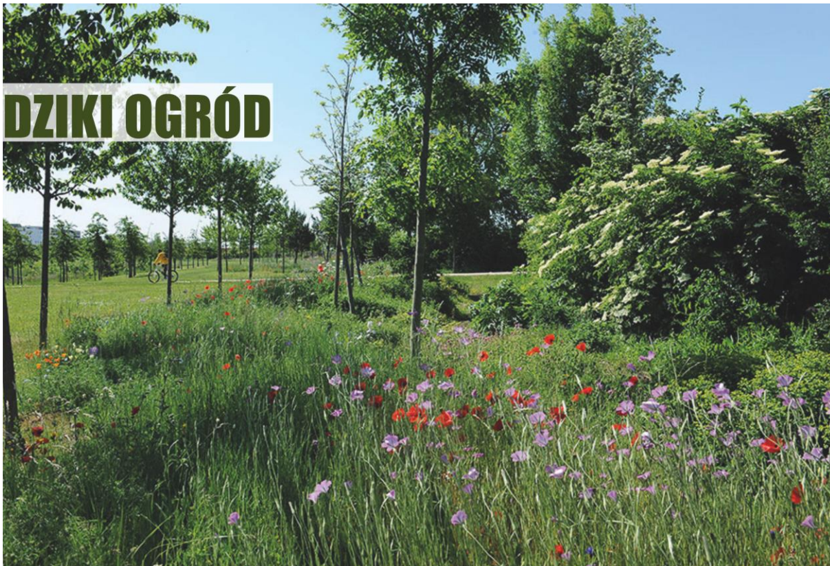
Zdjęcie nr 3 – DZIKI OGRÓD (reprodukcja referencji archiwum warsztatowego).