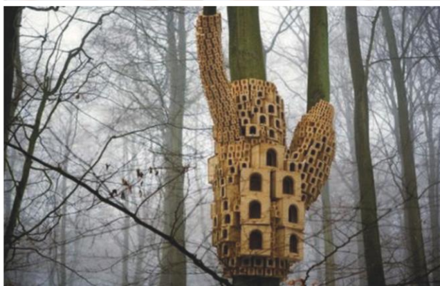
Zdjęcie nr 4 – ŚCIEŻKA DO OBSERWACJI PTAKÓW (reprodukcja referencji archiwum warsztatowego).