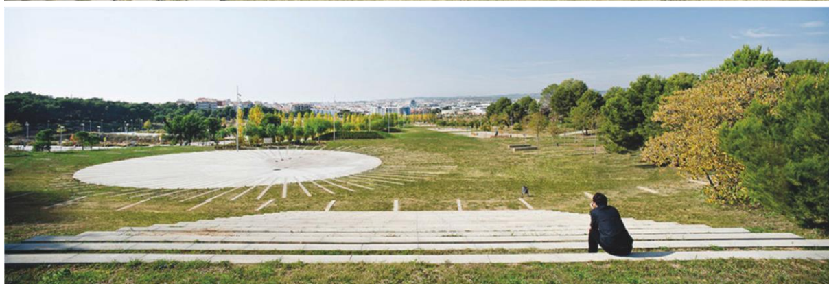
Zdjęcie nr 9 – AMFITEATR (reprodukcja referencji archiwum warsztatowego).