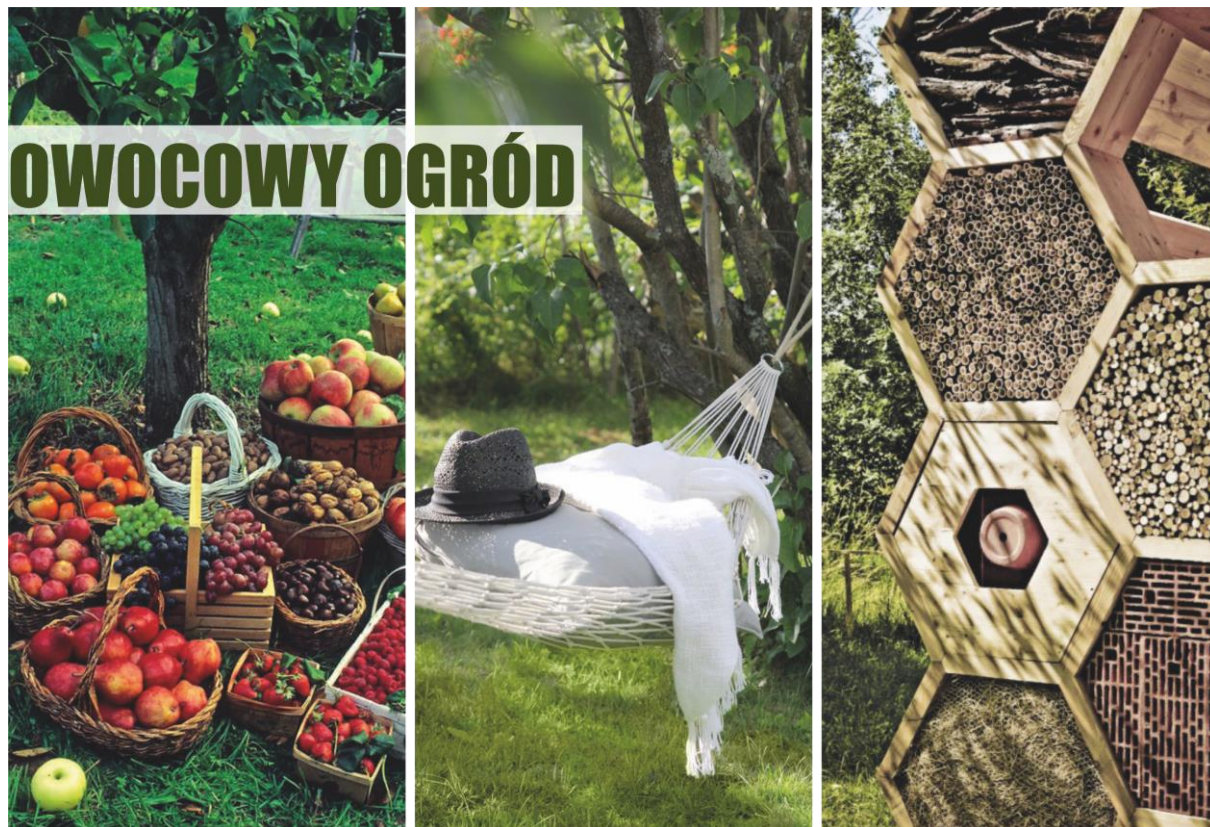
Zdjęcie nr 8- OWOCOWY OGRÓD (reprodukcja referencji archiwum warsztatowego).