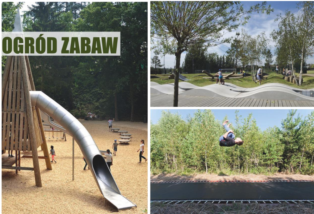
Zdjęcie nr 5 – OGRÓD ZABAW (reprodukcja referencji archiwum warsztatowego).

Wychodząc z Tajemniczego Ogrodu otwiera się przed nami piękna, otwarta przestrzeń. Podążamy wzdłuż głównej alei, która prowadzi nas w stronę Dzikiego Ogrodu . Pośród naturalnie rosnącej roślinności, wytyczona została szeroka aleja , którą co jakiś czas dochodzimy do nowych miejsc ciszy i wypoczynku. Wygodne ławki, leżaki, śpiew ptaków i książka – zestaw idealny.