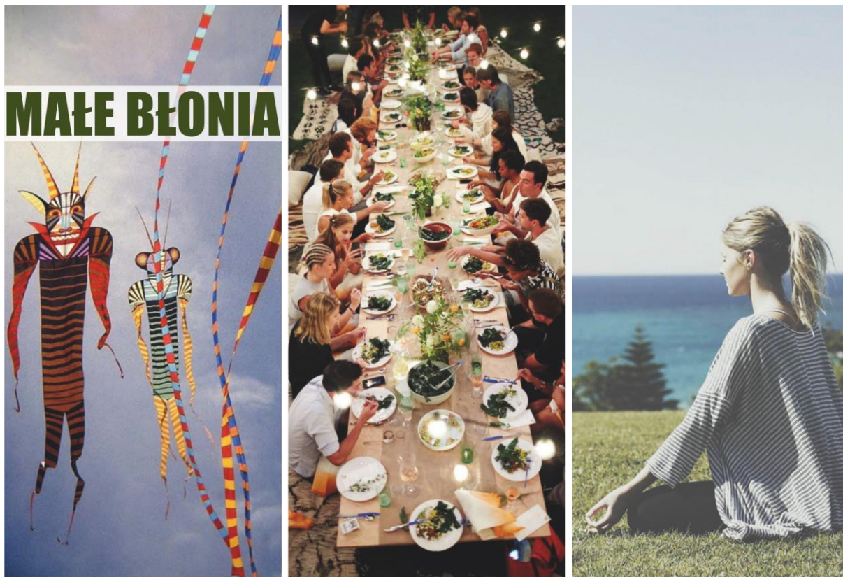
Zdjęcie nr 7- MAŁE BŁONIA (reprodukcja referencji archiwum warsztatowego).

Masa kolorowych, łąkowych kwiatów, piękny, soczysty zielony trawnik, promienie słoneczne – to właśnie nasza wielofunkcyjna polana . Otoczona ogrodami przestrzeń otwarta daje nieskończone możliwości użytkowania. Puszczanie latawców, grillowanie, badminton, piknikowanie, lokalne imprezy to tylko niektóre z nich. Ogranicza nas tylko nasza wyobraźnia. Spokojnie, rozstawiliśmy na całej polanie małe tabliczki ze wskazówkami , które pomogą Ci odkryć nowe aktywności.