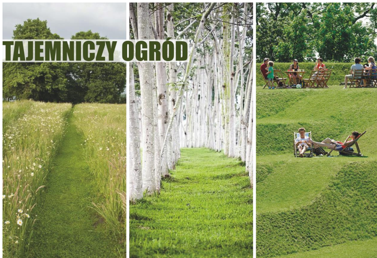
Zdjęcie nr 2 – TAJEMNICZY OGRÓD (reprodukcja referencji archiwum warsztatowego).

Zapraszamy do spaceru, w którym będą mogli Państwo odkryć krok po kroku naszą wizję projektową. Zaczynamy!