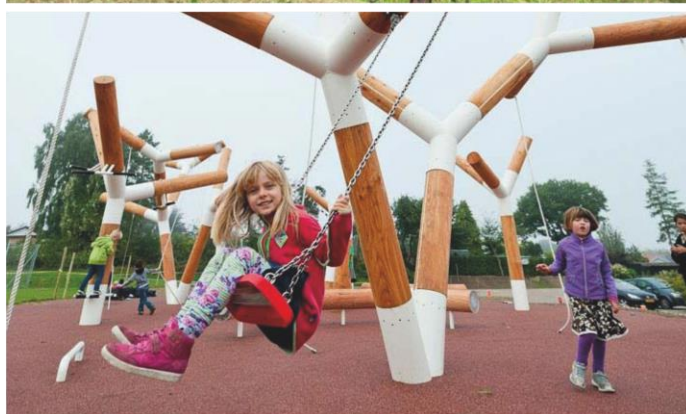
Zdjęcie nr 6 – AKTYWNY OGRÓD.

Z Ogrodu Zabaw płynnie przechodzimy do kolejnej, zdecydowanie bardziej uporządkowanej strefy – Ogrodu Aktywnego . Pośród wypielęgnowanej zieleni znajdziemy wielofunkcyjne boiska do gry m.in. w koszykówkę, piłkę nożną, siatkówkę czy tenis . Możemy także spróbować odkryć mniej znane aktywności sportowe m.in. grę w bule, kapsle, minigolf czy tor do jazdy zdalnie sterowanymi samochodzikami . Nie martwcie się, jeśli nie macie swojego sprzętu, możecie go wypożyczyć w parkowym pawilonie. Aktywny ogród wyposażony jest także w miejsca wypoczynku , gdzie w cieniu drzew możemy rozłożyć się na drewnianych leżakach i odpocząć. Zadbano także o osoby uprawiające dyscypliny indywidualne – znajduje się tu street workout park oraz urządzenia do ćwiczeń . Zatoczyliśmy krąg, wracamy do miejsca, w którym rozpoczęliśmy nasz spacer – Tajemniczego Ogrodu. Nie jest to jednak wszystko, co chcieliśmy Wam pokazać, najlepsze zostawiliśmy na koniec!