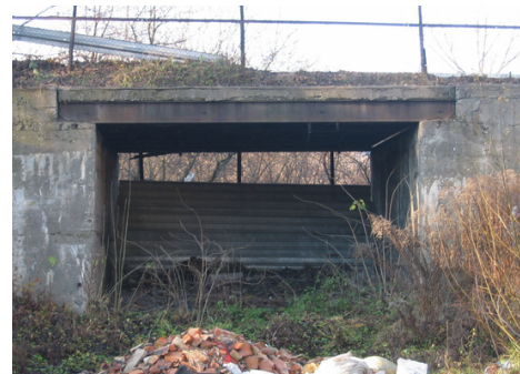
Wiadukt nad bocznicą kolejową