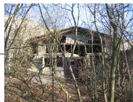
Magazyn prochu (laboratorium, biuro)