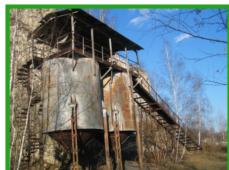
Silosy na koks