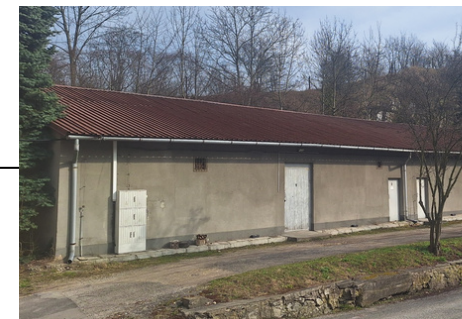
Magazyn/Lazaret i barak mieszkalny