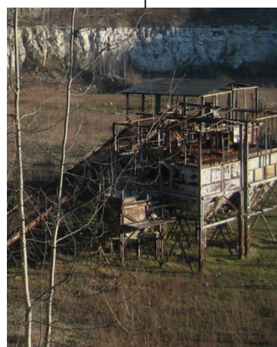
Przenośnik taśmowy i zbiorniki na wapno