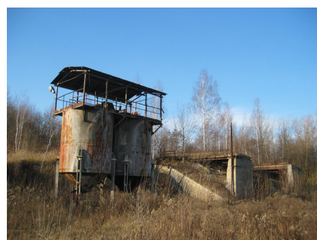
Fragment zakładu przeróbczego