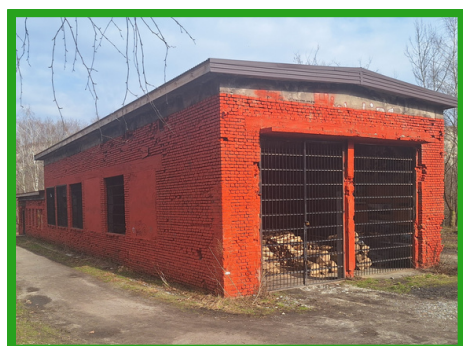
Remiza pojazdów kolejek wąskotorowych (warsztaty)