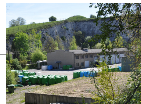
Budynki garażowo- warsztatowe