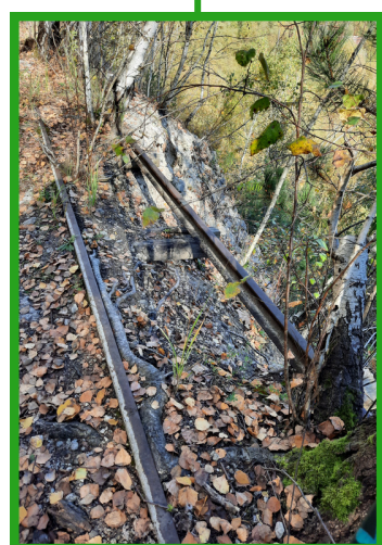
Fragment torów kolejki wąskotorowej