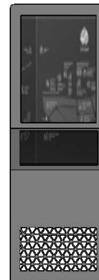
PROPOZYCJA 1.C FORMA PULPITOWA GDZIE MOŻNA DOBRZE WYEKSPONOWAĆ MAPĘ TERENU