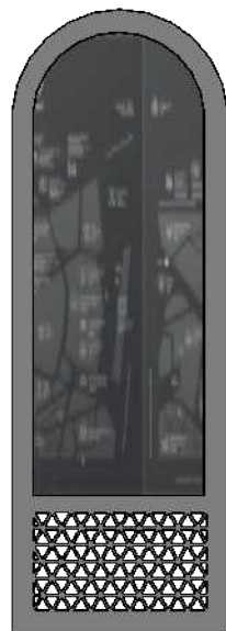
PROPOZYCJA 1.B FORMA TABLICY NAWIĄZUJĄCA DO MACEWY, MNIEJSZA ILOŚĆ TEKSTU ALE BARDZIEJ SUGESTYWNA