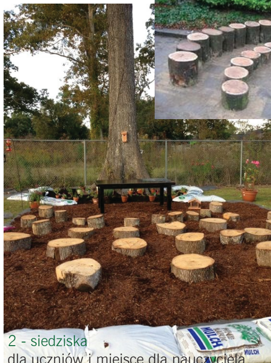
2 - siedziska dla uczniów i miejsce dla nauczyciela